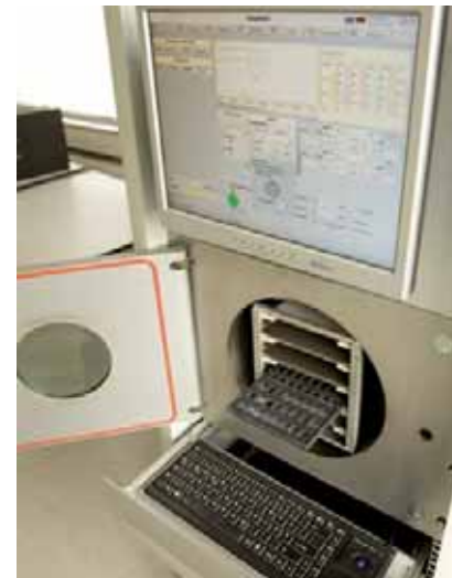
Für Bilder mit höherer Auflösung wenden Sie sich bitte direkt an den Aussteller.

HTV Halbleiter-, Test- und Vertriebs GmbH Robert-Bosch-Str. 28 64625 Bensheim Holger Krumme Mobil +49 171 1 21 29 93 Tel. (+49 62 51) 84 80 00 krumme@htv-gmbh.de